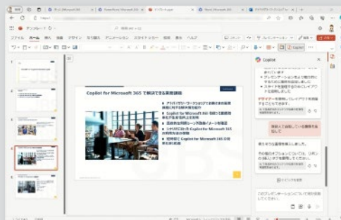
活用編 提案書の作成 - PowerPoint で提案書作成