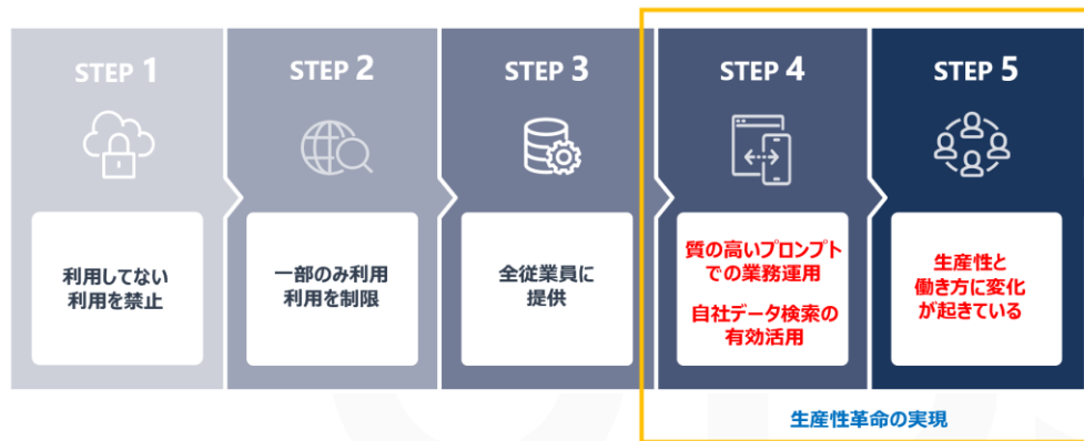
参考：企業における生成 AI の活用ステップ

これらの課題に着目し、JBS は「Copilot NAVI」を皮切りに、「Copilot」をはじめとする生成 AI が日々の業務において当たり前活用され、皆さまの “everyday Companion” となるための環境づくりと、デジタル変革を実現するサービスを順次展開してまいります。