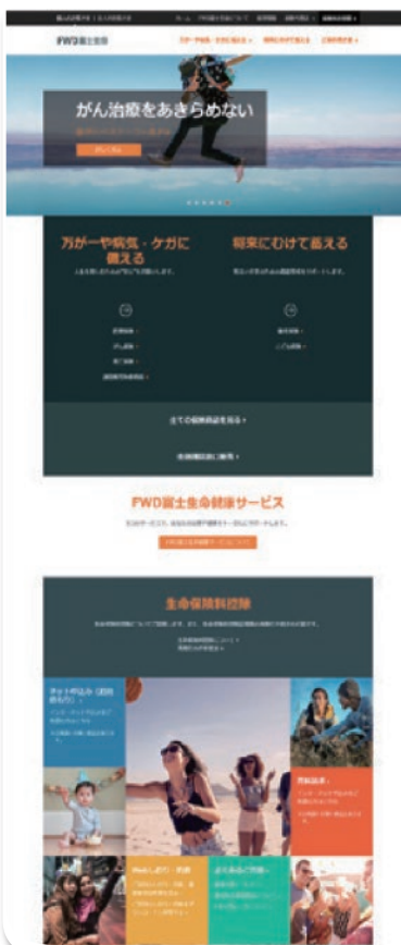
FWD 富士生命保険 コーポレートウェブサイトの トップ画面