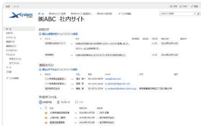
ポータルサイトのサンプルイメージ

ご契約いただいたお客様専用のポータルサイトを提供します。ポータルサイト内では「スケジュール」「お知らせ機能」「連絡先リスト」といった、IPO 関連業務のスケジュールを管理するための各種便利機能をご利用いただけます。